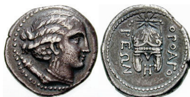
Figura 7. Estatera de Orthagoria (Macedonia), 300 a.C.

ORTHAGORIA: (350 a.C. o después). AR, Estatera persa. A/Cabeza de Artemis a derecha. R/Casco estelado. Alrededor leyenda: ΟΠΘΑΓΟ ΡΕΩΝ. S.N.G. Cop.: 689.