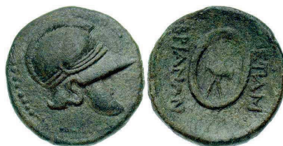
Figura 6. Moneda de bronce de Mesembria (300-250 a.C. AE 20mm.).

MESEMBRIA: (III-II siglo a.C.). AE. A/Casco ático de lado. R/Rueda en perspectiva con leyenda alrededor: METAMBPIANQN. S.N.G. Cop.: 658.