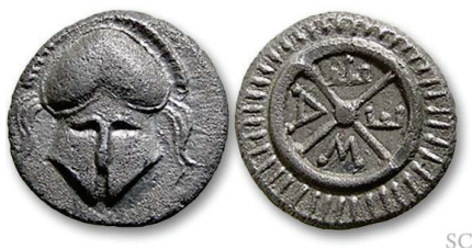
Figura 5. Dióbolo de Mesembria. S.N.G. Cop: 652/3.

MESEMBRIA: (III-II siglo a.C.). AE. A/Casco corintio de frente. R/Rueda de carro con cuatro radios y letra entre ellos: M E T A. S.N.G. Cop.: 654-655.