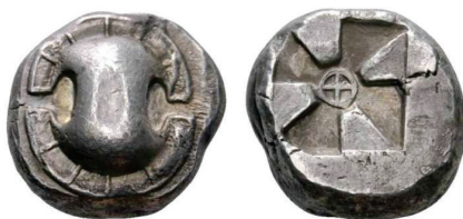
Figura 23. Estatera beocia. (500-480a. C. AR 12,31 g.)

TEBAS: (550-480 a.C.). AR. Estatera, dracma y hemiόbolo. A/Escudo beocio. R/Cuadrado incuso con rueda de cuatro radios en el centro. S.N.G. Cop.: 248-259.