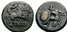
Figura 1. Moneda de bronce del Quersonezo trácico (350-300 BC. AE 21mm.). S.N.G. Cop: 7.

(300-200 a.C.). AE. A/Cuádriga guiada por Artemis Partenos a derecha. R/Guerrero desnudo agachado tras su escudo. Detrás leyenda: XEP. S.N.G. Cop.: 7.