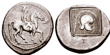
Figura 11. Estatera de Orthagoria (Macedonia), 300 a.C.

S.N.G. Cop: 689.