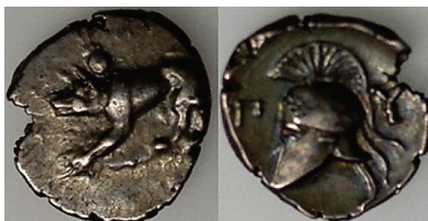
Figura 25. Óbolo de Argos. (421a. C. AR 10mm, 1,20 g.)

ARGOS: (421.343 a.C.). AR, dióbolo y óbolo. A/Lobo o perro a izquierda en posición de ataque. R/casco corintio con cresta a izquierda. S.N.G. Cop.: 21-22.