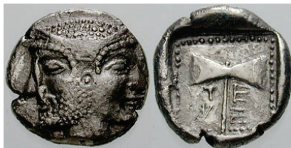
Figura 28. Didracma de Tenedos. (550-470a. C. AR 17mm, 7,79 g.)

ISLA DE TENEDOS: (550-siglo I a.C.). AR., tetradracma, didracma, dracma y hemidracma. A/Cabeza masculina y femenina bifronte. R/Doble hacha en algunos casos con leyenda alrededor: TENEDION. S.N.G. Cop.: 505-525.