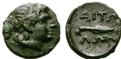
Figura 20. Moneda de bronce etolia. (290-220a. C. AE 12mm, 1,66 g.)

LIGA AETOLIA: (279-168 a.C.). A/Cabeza de Etolia con kausia a derecha. Rev. Punta de lanza horizontal y leyenda encima y debajo: ΑΙΤΩ-ΛΩΝ. S.N.G. Cop.: 22-24.