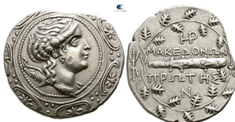
Figura 9. Estatera de Orthagoria (Macedonia), 300 a.C. S.N.G. Cop: 689.

ANFÍPOLIS: (167-149 a.C.). Tetradracma. A/Escudo macedonio con cabeza diademada de Artemisa a derecha. R/Maza dentro de laurea encima y debajo leyenda: ΜΑΚΕΔΟΝΩΝ – ΠΡΟΤΗΣ. S.N.G. Cop.: 51-56.