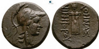
Figura 27. Moneda de bronce de Pérgamo. (siglo IIa.C. AE 16mm, 7,22 g.)

PERGAMO: (200-133 a.C.). AE. A/Cabeza de Atenea a derecha. R/Trofeo con coraza y casco. Leyenda: ΑΘΗΝΑΣ ΝΙΚΗΦΟΡΟΥ. S.N.G. Cop.: 393-399.