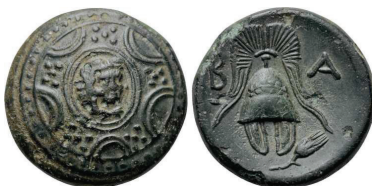
Figura 14. Moneda de bronce de Alejandro III de Macedonia (336-323 a.C. Æ 18mm, ceca macedonia).

(Después del 311). A/Escudo macedonio. R/casco macedonio. Alrededor leyenda: ΒΑΣΙΛΕΩΣ. S.N.G. Cop: 1118-1137. Este tipo se repetirá reiteradamente con variaciones en el escudo y posteriormente en las acuñaciones de los reyes Demetrios Poliorcetes (292-291 a.C.) y Pirro (288-284 y 274-272 a. C).