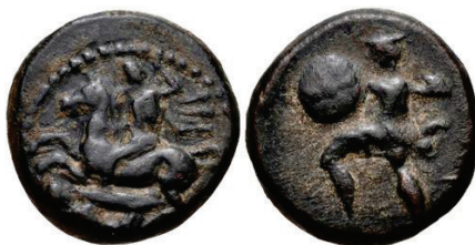
Figura 18. Moneda de bronce de Pelinna. (Siglo IV a.C. AE 14mm, 3.02 g.)

PELINNA: (400-344 a.C.). AR., trihemíobolo. A/Jinete con lanza atacando. R/Guerrero con petaso, escudo y dos lanzas, corriendo a izquierda. S.N.G. Cop.: 185-187.