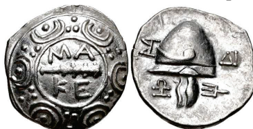
Figura 10. Estatera de Orthagoria (Macedonia), 300 a.C. S.N.G. Cop: 689.

ANFÍPOLIS: (187-168 a.C.). Tetróbolo. A/Escudo macedonio con maza y leyenda MA -KE en el centro. R/Casco macedonio a izquierda S.N.G. Cop.: 51-56.