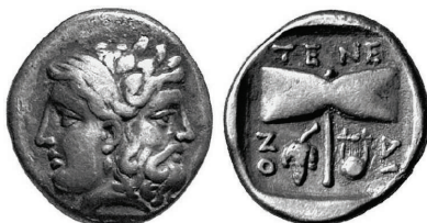
Figura 29. Dracma de Tenedos. (450-387a. C. AR 17mm, 3,6 g.)

ISLA DE TENEDOS: (siglos II-I a.C.). AR., tetradracma, y dracma. A/Cabeza femenina a izquierda. R/Doble hacha dentro de corona de laurel, en algunos casos con leyenda alrededor: TENEDION. S.N.G. Cop.: 526-529.