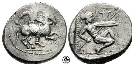
Figura 30. Estatera de Tenedos. (425-400a. C. AR, 10,13 g.)

TARSUS: (Siglo V a.C.). AR, estatera. A/Jinete real al galope con látigo y birrete persa. R/Hoplita desnudo con casco corintio con cresta, arrodillado a izquierda portando lanza y escudo decorado con Gorgona en el centro. S.N.G. Cop.: 259.