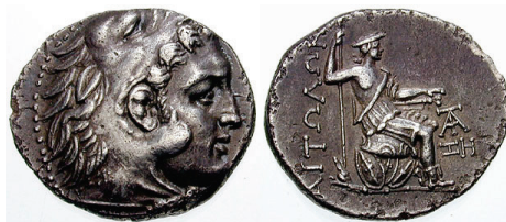
Figura 19. Moneda de bronce de Pelinna. (Siglo IV a.C. AE 14mm, 3.02 g.)

LIGA AETOLIA: (279-168 a.C.). A/Cabeza de Heracles con leonté a derecha. Rev. Aetolia sentada sobre un trofeo de acumulación de escudos, con lanza y espada. Leyenda: ΑΙΤΩΛΩΝ. S.N.G. Cop.: 2-3.