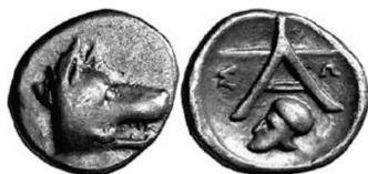
Figura 26. Óbolo de Argos. (350-228a. C. AR 10mm, 0,87 g.)

ARGOS: (350-228 a.C.). AR, óbolo. A/Prótomo de lobo o perro a derecha. R/Leyenda: A ΣΩ. Debajo casco corintio. S.N.G. Cop.: 75.