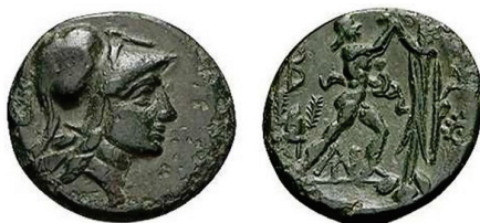
Figura 17. Moneda de bronce de Antigono Gonatas (AE 19 mm.)

ANTIGONO GONATA: (277-239 a.C.). AE. A/Cabeza de Atenea a derecha. R/Pan erigiendo trofeo. S.N.G. Cop.: 1206-1213.