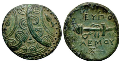
Figura 15. Moneda de bronce de Eupolemo. Ceca de Mylasa, Caria. (295-280 a.C. AE 17mm, 4,76gr.)

EUPOLEMO: (314 a.C.). AE. A/Tres escudos macedonios solapados. R/Espada con vaina y correa. Alrededor leyenda: ΕΥΠΟΛΕΜΟΥ. S.N.G. Cop.: 1165-1169.