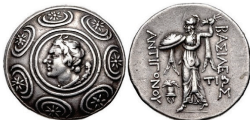
Figura 16. Tetradracma Antigonos Gonatas. Anfípolis.

ANTIGONO GONATA: (277-239 a.C.). AR. Tetradracma. A/Escudo macedonio con cabeza de Pan en el centro, a derecha. R/ Atenea Alkis con escudo y lanza en posición de ataque. A los lados leyenda: ΑΝΤΙΓΟΝΟΥ ΒΑΣΙΛΕΩΣ. S.N.G. Cop.: 1198-1202.