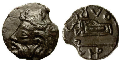
Figura 4. Moneda de bronce de Olbia (AE 21mm. 7.2 gr).

OLBIA: (III-I siglo a.C.). AE. A/Cabeza barbada con cuerno de Borysthene s, divinidad fluvial. R/carcaj y hacha con leyenda alrededor: OLBIO. S.N.G. Cop.: 85-94.