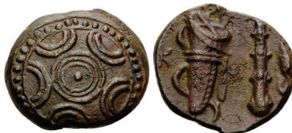
Figura 13. Moneda de bronce de Alejandro III de Macedonia (336-323 a.C. Æ 18mm, ceca macedonia).

(336-323 a.C.). A/Escudo macedonio. R/Maza, arco y carcaj. S.N.G. Cop: 1129.