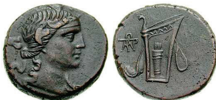
Figura 3. Moneda de bronce de Panticapeon (100-70 a.C. AE 25mm.).

(100-70 a.C.).AE. A/Cabeza de Dionisos coronado a derecha. R/Funda de arco y carcaj. Monograma a izquierda. S.N.G. Cop.: 10.