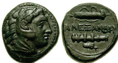
Figura 12. Moneda de bronce de Alejandro III de Macedonia (336-323 a.C. Æ 18mm, ceca macedonia).

ALEJANDRO III: (336-323 a.C.). AE. A/Cabeza de Alejandro II como Heracles a derecha. R/Maza, carcaj y arco, leyenda: ΑΛΕΞΑΝΔΡΟΥ. S.N.G. Cop.: 1037-1063.