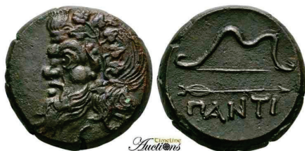
Figura 2. Moneda de bronce del Quersoneso trácico (350-300 BC. AE 21mm.).

S.N.G. Cop: 7.