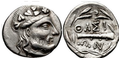
Figura 8. Estatera de Orthagoria (Macedonia), 300 a.C.

TASOS: (196-180 a.C.). Hemidracma (14mm, 1.21 g.). A/Cabeza de Dionisos a derecha. R/Maza dentro de laurea y leyenda ΘΑΣΙΟΝ. S.N.G. Cop.: 1036.